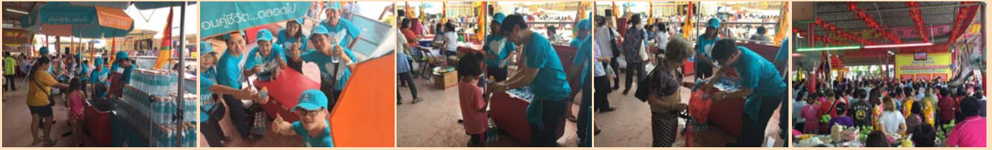
“งานประเพณี ขบวนแห่เจ้าพ่อหลักเมืองสมุทรสาคร ประจำปี 2558” ณ ตำบลมหาชัย อำเภอเมือง จังหวัดสมุทรสาคร ร่วมกิจกรรมโดย ไทยสมุทรประกันชีวิต สาขาสมุทรสาคร

ในช่วงที่ผ่านมา บริษัท ไทยสมุทรประกันชีวิต จำกัด (มหาชน) เดินหน้าจัดโครงการ “ประเพณี วิถีไทย...กับพีไทยสมุทร” อย่างต่อเนื่องทั่วประเทศ เพื่อร่วมสนับสนุนกิจกรรมวัฒนธรรมประเพณีท้องถิ่น รวมถึงกิจกรรมกระตุ้นการท่องเที่ยวในพื้นที่ต่าง ๆ ทั่วประเทศ โดยส่งเสริมให้ฝ่ายขายช่องทางตัวแทน เข้าไปมีส่วนร่วมในการจัดกิจกรรมดังกล่าวด้วย ทั้งนี้ เพื่อสร้างความสัมพันธ์กับชุมชนให้แน่นแฟ้นยิ่งขึ้น ในฐานะที่เราชาวไทยสมุทรทุกคนเป็น “เพื่อนคู่ชีวิต...ตลอดไป” กับพี่น้องชาวไทย