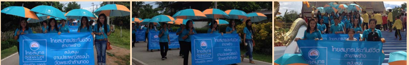
“งานประเพณีสงกรานต์ วัดพระเจ้าล้านทอง และขบวนแห่พระเจ้าเข้าเมือง” ณ บริเวณถนนรอบอำเภอฟ้า จังหวัดเชียงใหม่ ร่วมกิจกรรมโดย ไทยสมุทรประกันชีวิต สาขาฟ้าว