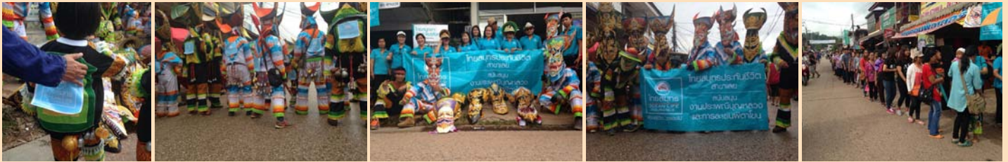
“งานประเพณีบุญหลวง และการละเล่นผีตาโขน” ณ อำเภอด่านซ้าย จังหวัดเลย ร่วมกิจกรรมโดย ไทยสมุทรประกันชีวิต สาขาเลย