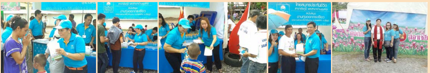
“งานทุ่งดอกกระเจียว อุทยานแห่งชาติป่าหินงาม” ณ อุทยานแห่งชาติป่าหินงาม จังหวัดชัยภูมิ ร่วมกิจกรรมโดย ไทยสมุทรประกันชีวิต สาขาชัยภูมิ และสาขาด่านขุนทด