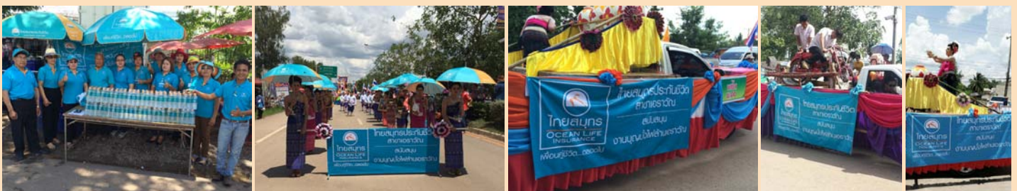
“งานบุญบั้งไฟล้านเอราวัณ” ณ เทศบาลพาณิชย์แปลง อำเภอรอวัน จังหวัดเลย ร่วมกิจกรรมโดย ไทยสมุทรประกันชีวิต สาขาเอราวัณ